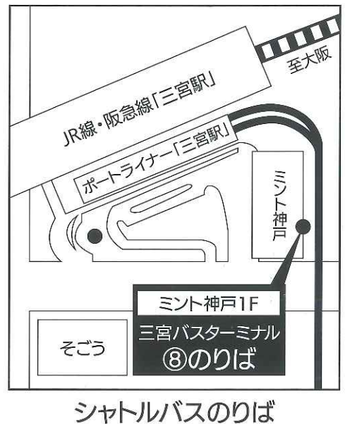
シャトルバスのりば