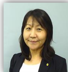
社労士事務所 HANA代表