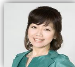
トータルアドバイザー オフィス代表